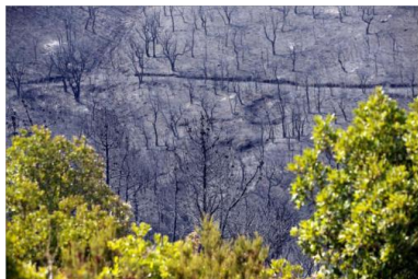
Terre brûlée à Bormes-les-Mimosas