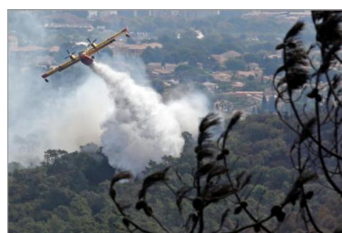
Lâcher d'eau sur la forêt