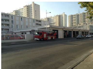
Caserne de Toulon

à la française peut rapidement atteindre ses limites. Dans ces conditions, l'efficacité des sapeurs est déjà de l'ordre du miraculeux », estime le chercheur.