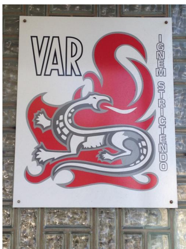
Écusson des pompiers du Var